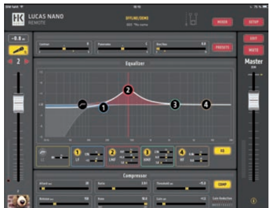
Im Expertenmodus lässt sich deutlich detaillierter am Sound schrauben