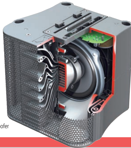
... der System-Subwoofer

kabel zu einem Stereosystem (mit zwei Subwoofern und vier Satelliten) koppeln lassen. Die dadurch erreichte Flexibilität dürfte eine Menge möglicher Anwendungen abdecken.