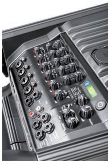
Anschlüsse und Bedienoberfläche beim „Nano 608i“ Sub – auf der Oberseite ist die Mixereinheit verbaut, die vier Mic/Line-Eingänge (zwei Kanäle mit Phantom Power) und zwei weitere Stereo-Line-Kanäle verwaltet

Eins, zwei, drei vier fünf ... Lucas „Nano 608i“ durfte auf insgesamt fünf unterschiedlichen Veranstaltungen seine Flexibilität unter Beweis stellen. Neben zwei DJ-Ein-