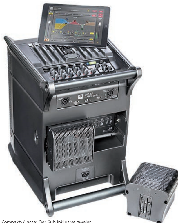
Kompakt-Klasse: Der Sub inklusive zweier Sats wiegt gerade mal 16,3 kg

sätzen im Twin-Stereo-Betrieb für je 100 Zuhörer, beschallte Fingerstyle-Gitarrist Timo Brauers den etwa 120 Leute fassenden Veranstaltungsraum des Acoustic Delite Music Shop in Viersen in der Mono-Variante samt Distanzstange. Im Varieté Freigeist nutzten Brian Palisander & the Motherfuckers die Twin-Stereo-Variante, um 60 Zuhörer adäquat zu beschallen, während