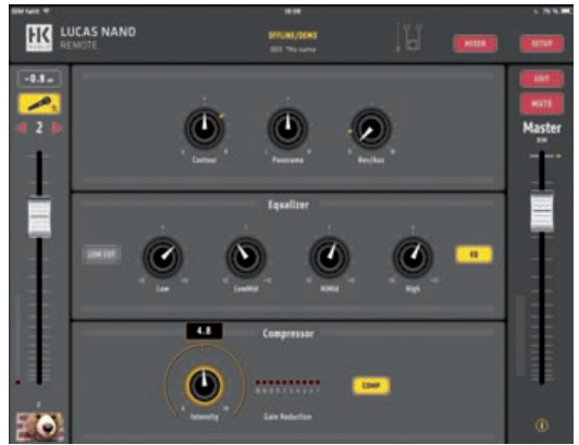
In der einfachen Ansicht der iPad App sind die Bedienelemente auf das Wesentliche reduziert