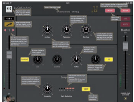
Hilfestellung leistet auf Wunsch ein Overlay, das die verfügbaren Bedienelemente erklärt